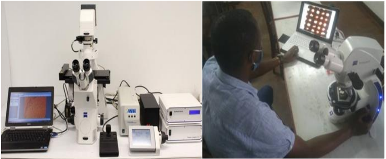
The University of Dar es Salaam Polarizing Microscope for testing the quality of face masks